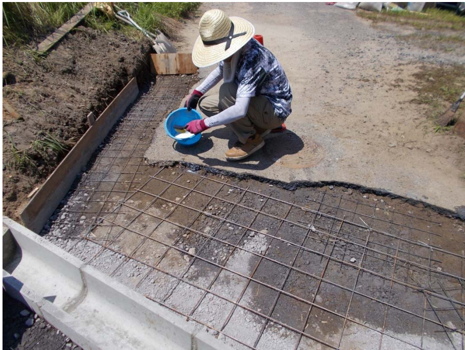
陥没農道の嵩上げ