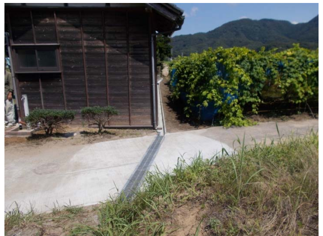
グレーチング設置と排水路設置