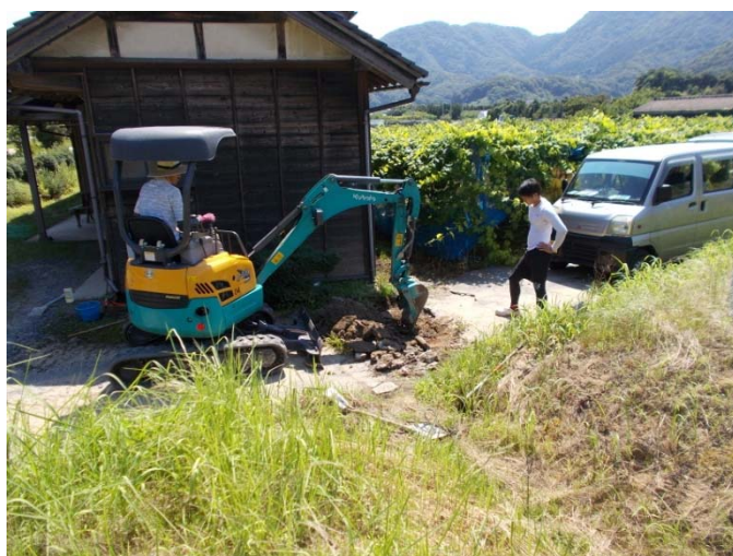
農道横断U字溝設置溝の掘削