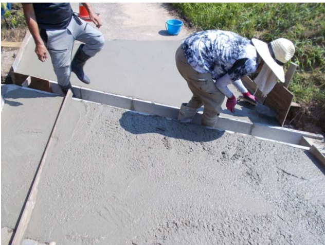
農道のコンクリート打ち