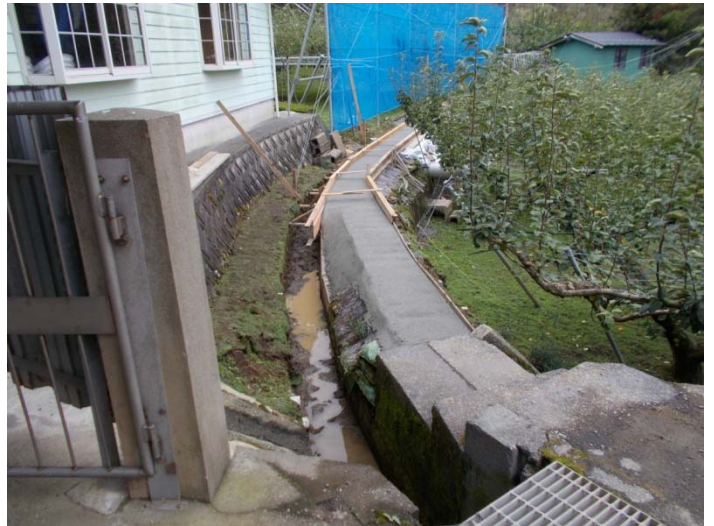
活動前写真と同じ場所で写したほぼ完成後