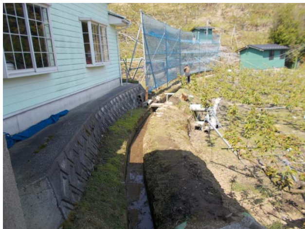
水路壁が沈み大雨になると谷側果樹園に流入