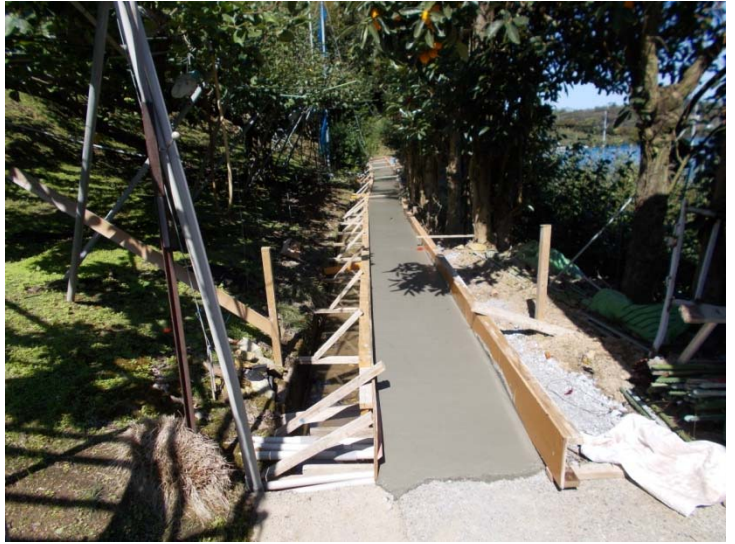
型枠とコンクリート打設