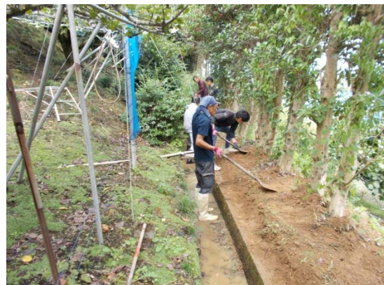
通路の土のすき取り作業