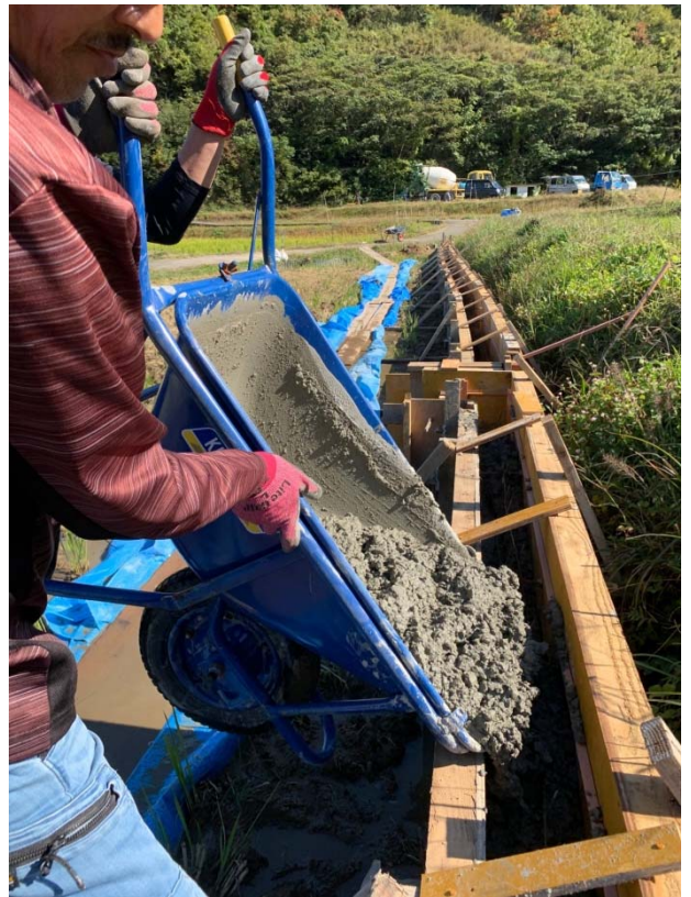
コンクリート打設