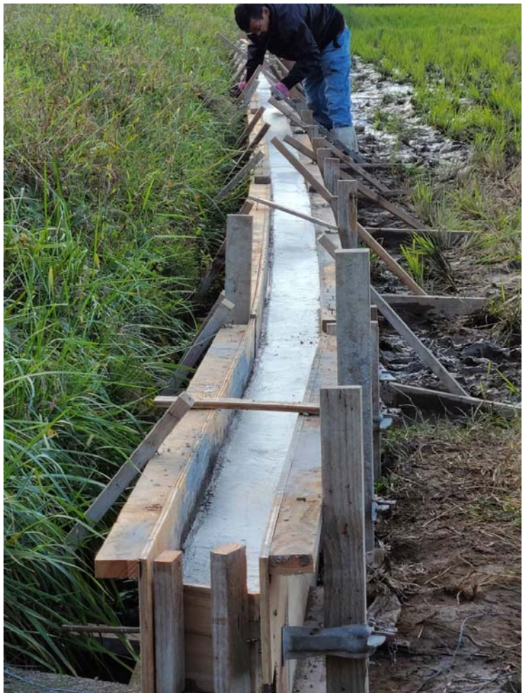
コンクリート打設完了