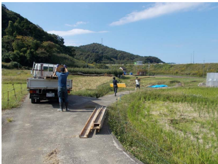
水路壁の型枠設置