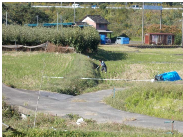
水路壁が沈み大雨になると水田に流入