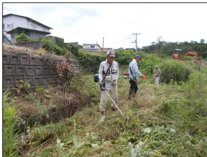
水路脇の草刈り作業