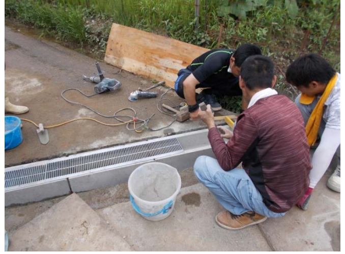
U字溝設置とグレーチング設置