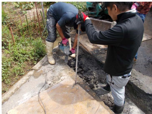
道路横断U字溝設置溝の掘削