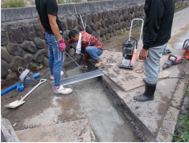
U字溝設置溝のの仕上げ