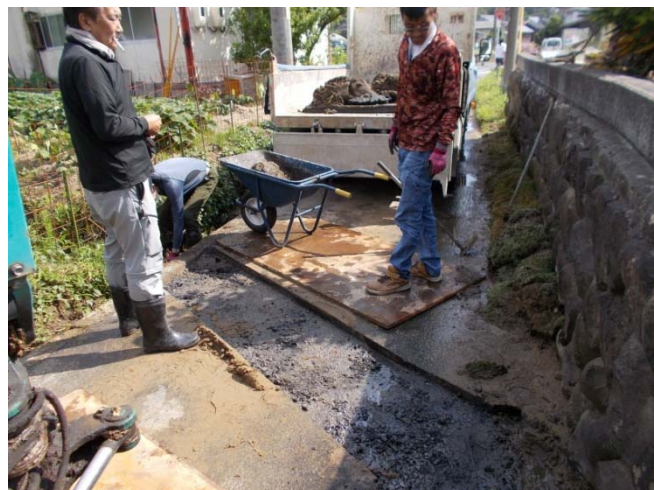
U字溝設置溝のコンクリート打ち