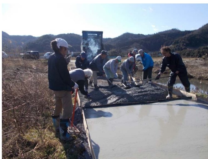
昨年の経験があり要領良く作業