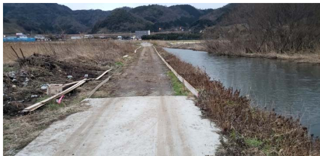
昨年に農道の半分が完了した状態