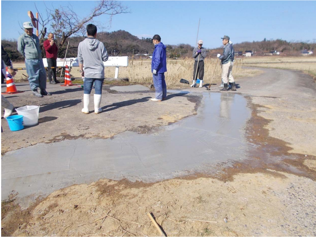
残りのコンクリートで橋の接続部分が陥没していた部分も修復です。